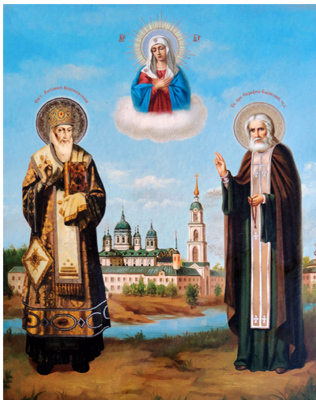
Духовные братья: Святитель Антоний Воронежский и преподобный Серафим Саровский. Икона из алтаря Антониевского храма.

Размышляя о традиционном Митрофано-Тихоновском Крестном ходе, нельзя не назвать третьего воронежского святителя, чья личность символически и духовно объединила имена святителей Митрофана и Тихона. Это архиепископ Антоний (Смирницкий), которого по праву называют одним из иерархов, чьи поступки и решения повлияли на облик русского Православия в XIX и XX столетиях.