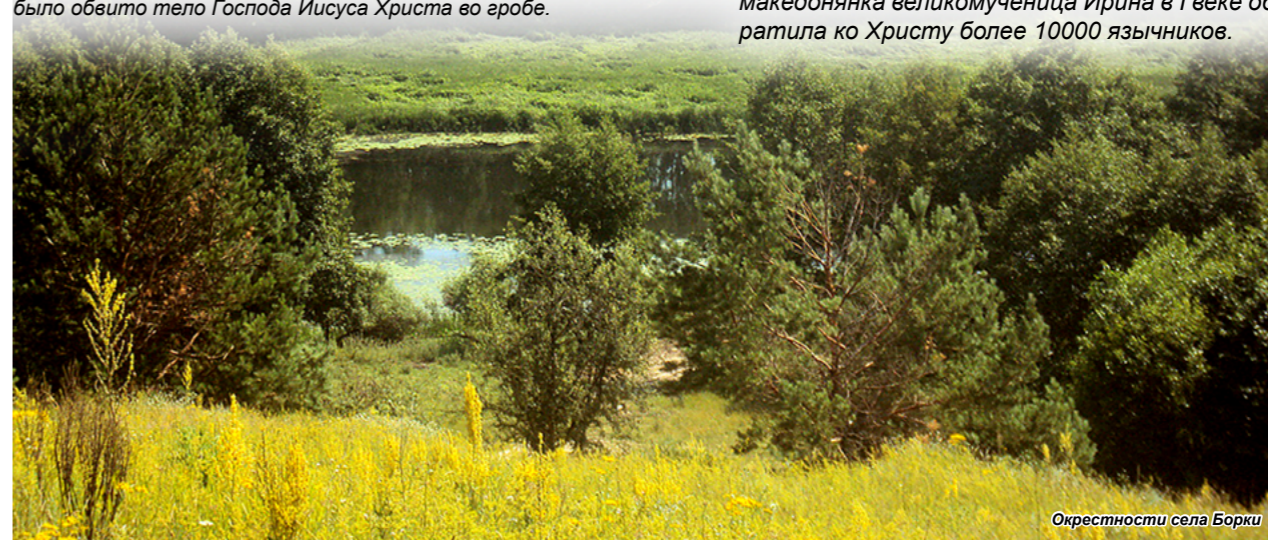
Окрестности села Борки

СВЯТАЯ ИРИНА. Имя её означает «мир», «покой». Крещённая ещё в юности апостолом Тимофеем, учеником апостола Павла, знатная македонянка великомученица Ирина в I веке обратила ко Христу более 10000 язычников.